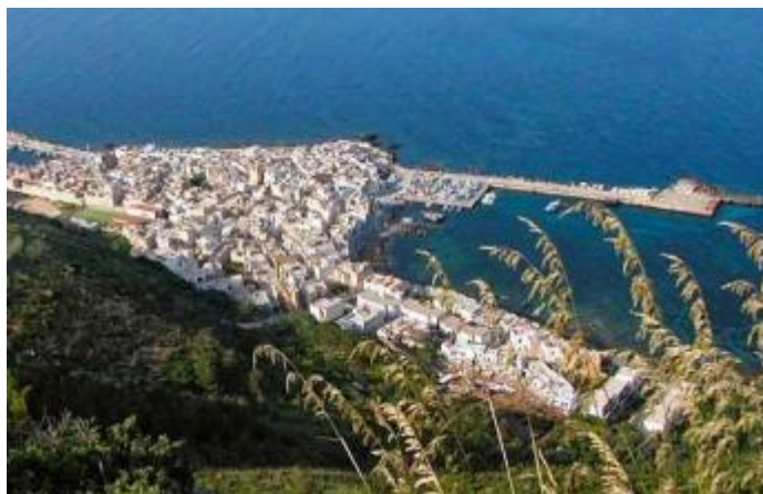
Port de Marettimo (avant la construction du ponton)

L'amarrage est également autorisé sur le Molo San Leonardo dans des profondeurs comprises entre 4,0 et 5,0 mètres entre 19 h 30 et 19 h 30.