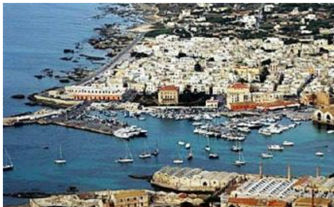
Cala Principale, Favignana